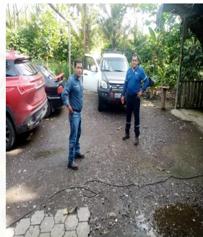
USUARIO: CLAROS OMAR GESTIÓN CNEL