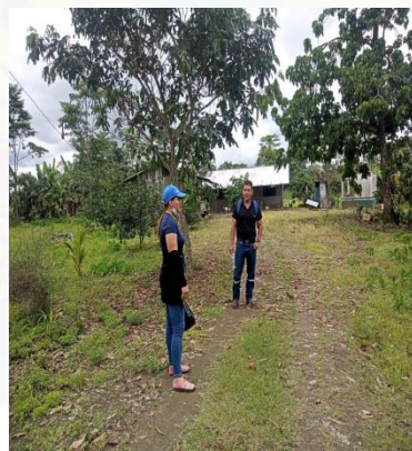
CASA USUARIO BRITO ANGEL