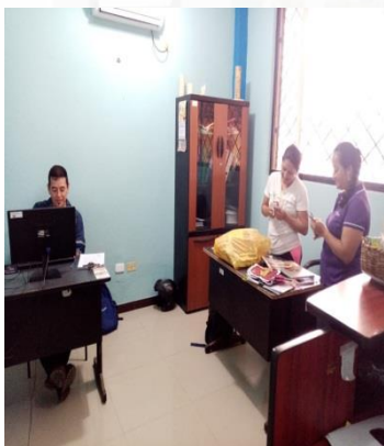
TRABAJO EN OFICINA