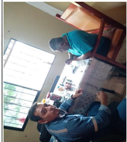
USUARIO: PONE RIDE