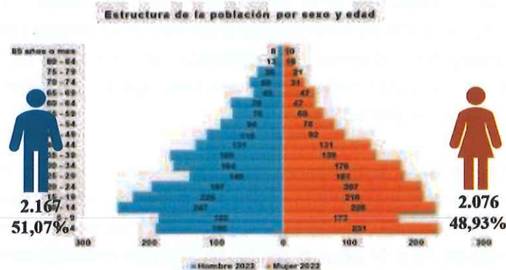
Figura N°. 1. Pirámide poblacional 2022

Fuente: INEC (Instituto Nacional de Estadística y Censos) 2022. Elaborado por: Equipo Técnico Consultor 2024